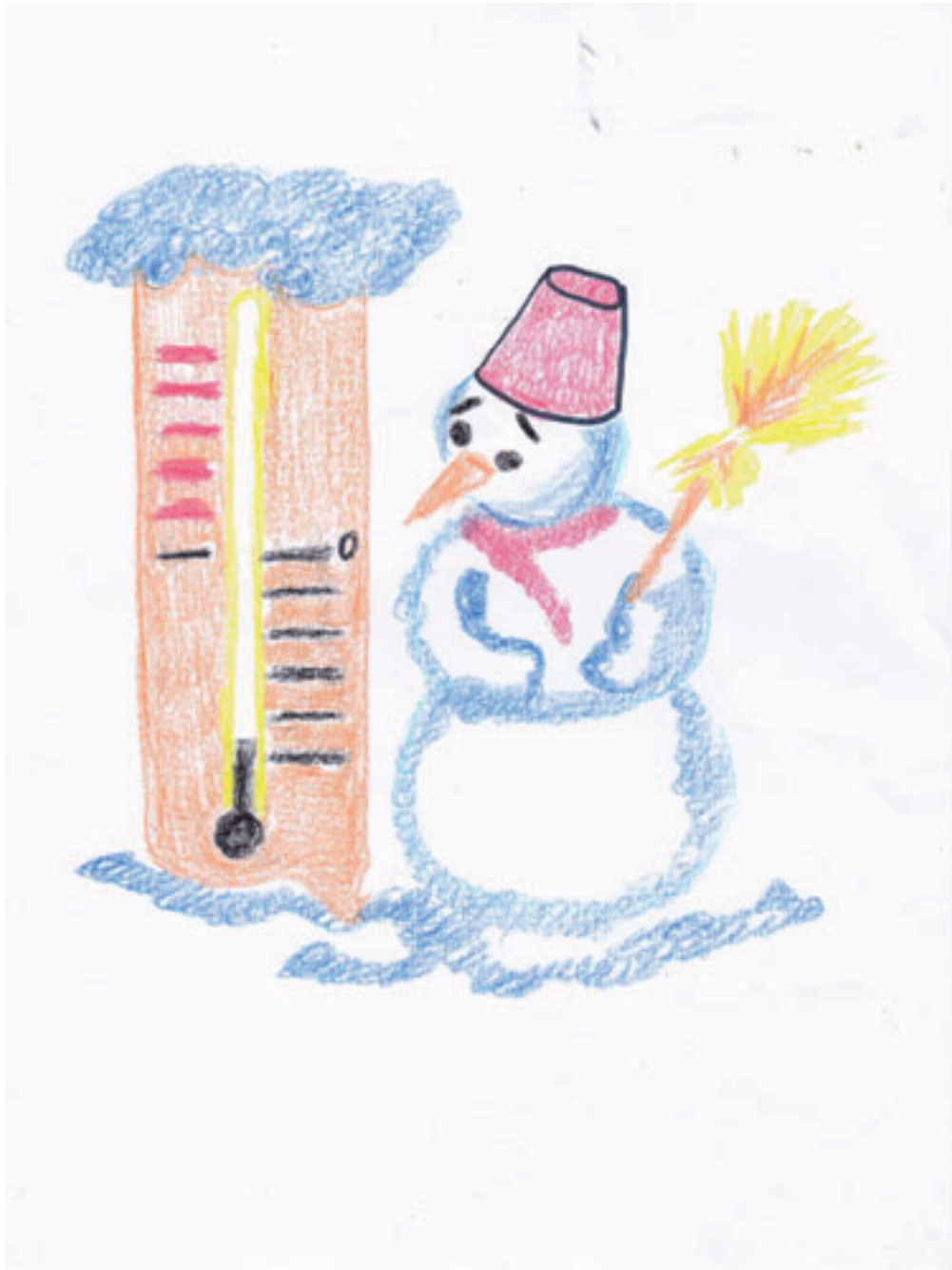
Dessin de Evan, Collège Champollion