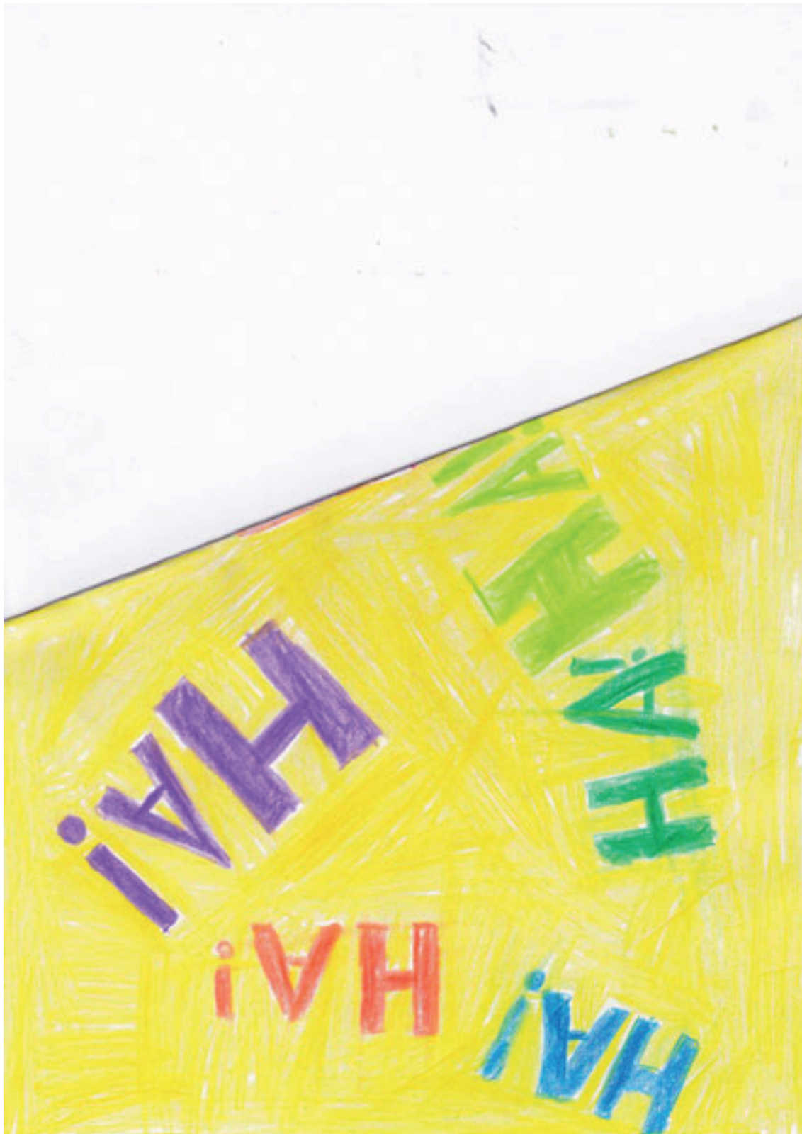
Dessin de Romain, Collège Champollion